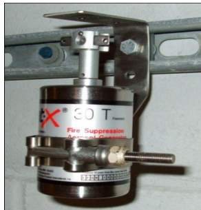
Montering av G30 och G60